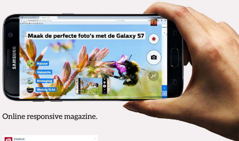
Online responsive magazine.