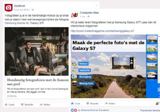
Facebook-campagne op Zoom.nl en Computer Idee.