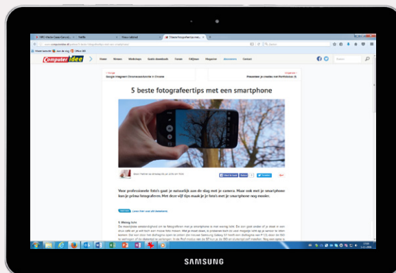
Partnerartikel op www.computeridee.nl

Ben je geïnteresseerd in de uitgebreide content-mogelijkheden voor jouw product of merk? Neem contact op met: